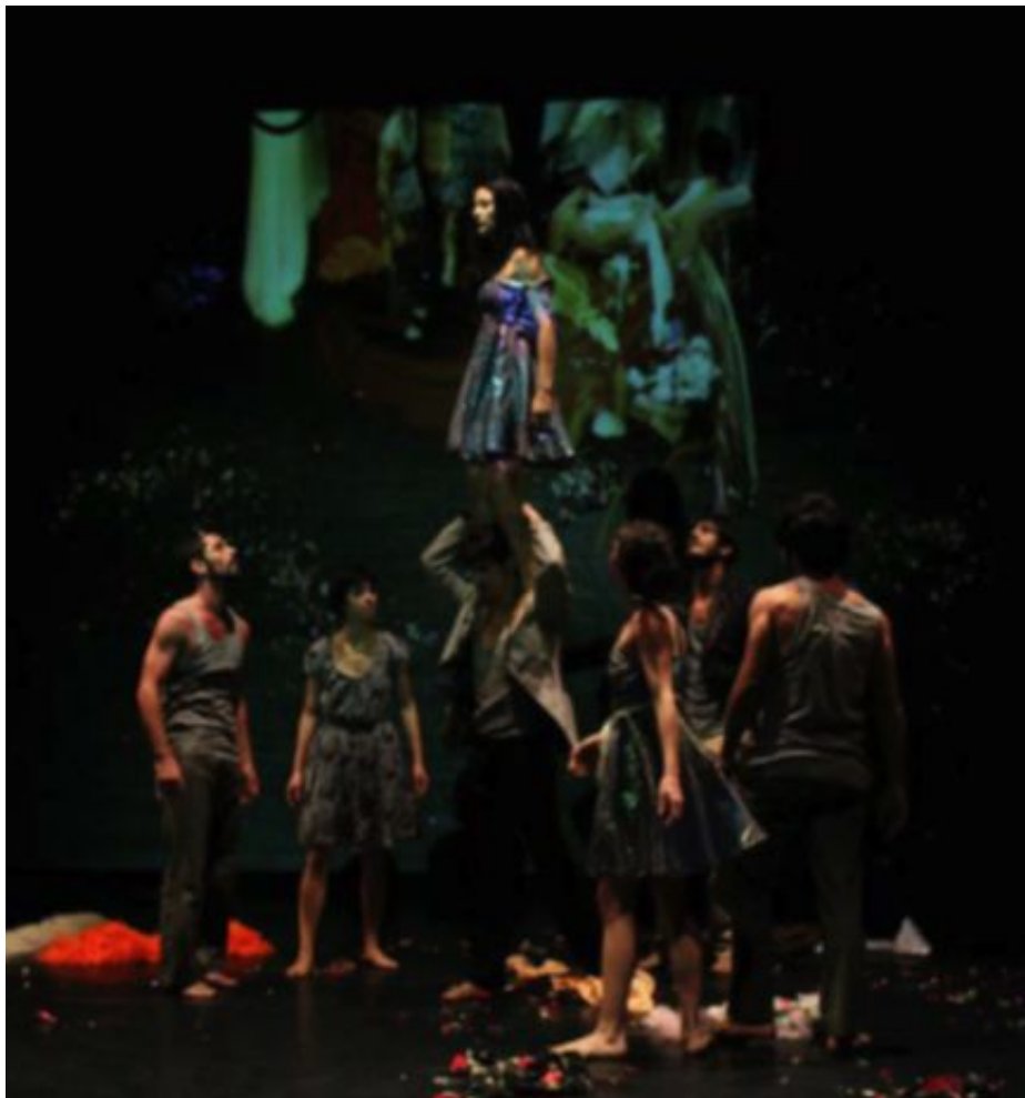
Memory Wax har utvecklat ett eget rörelsespråk.