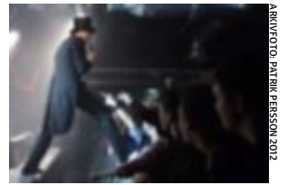
The Hives är på Japan-turné och Nina Persson i New York. Ingen kom till hovrätten igår.

Sedan dess har skulderna – och Tambourines sätt att sköta The Hives pengar – valsat genom rättsväsendet. The Hives har två gånger förlorat stort. Som en följd finns nu runt trettio miljoner kronor av deras tillgångar låsta hos Kronofogden i väntan på slutliga avgöranden.