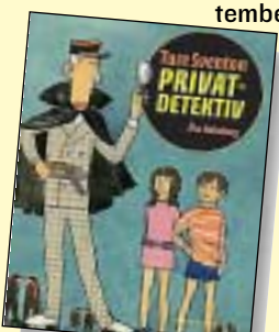
Den första Sventon.

I år är det 60 år sedan den första boken om Åke Holmbergs kult-