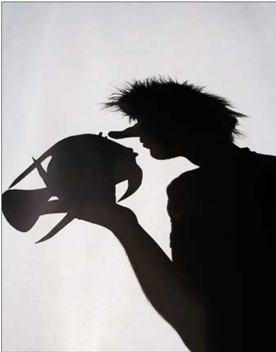
Memory Wax följer drömmarnas logik i dansföreställningen I skuggans land .

Här råder drömmens logik. Därför blir både människor och symboler betydelseglidande. Efter det inledande skuggspelet smyger dansarna fram genom skynket. Strax transformeras även de förinspelade skuggorna, får ansikten och kläder, som kopior av dansarna själva. Ett gladlynt svängom utvecklar